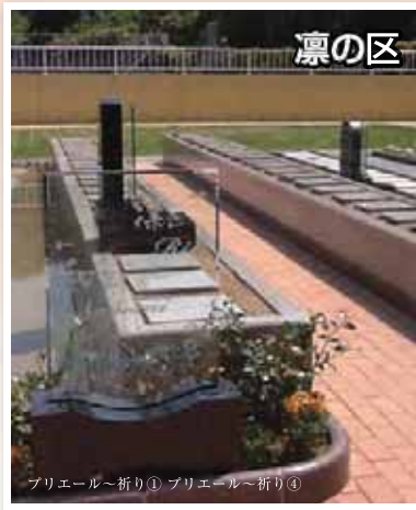
プリエール~祈り① プリエール~祈り④

□基本彫刻料込 (家名・碑言葉) □花柄やご戒名彫刻は別途 40,000 円 (税別) ~ □ガラス墓誌 70,000 円 (税別) ガラス板材質変更 10,000 円 (税別) ~